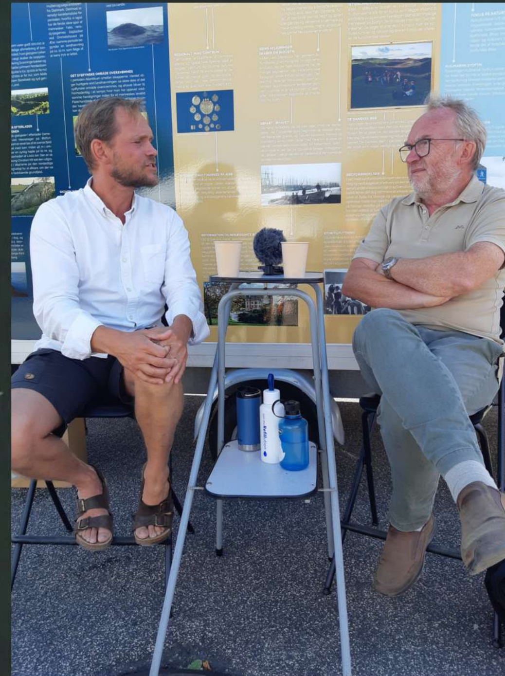
Klimafolkemøde med geopark talks, Middelfart.