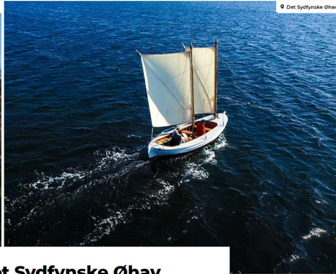
Det Sydfynske Øhav